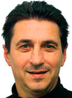
Wieland Schmidt: Auch 26 Jahre nach dem Coup noch stolz.

Olympiasieger. "Ich bin immer noch stolz auf diesen Titel", sagt Schmidt heute.